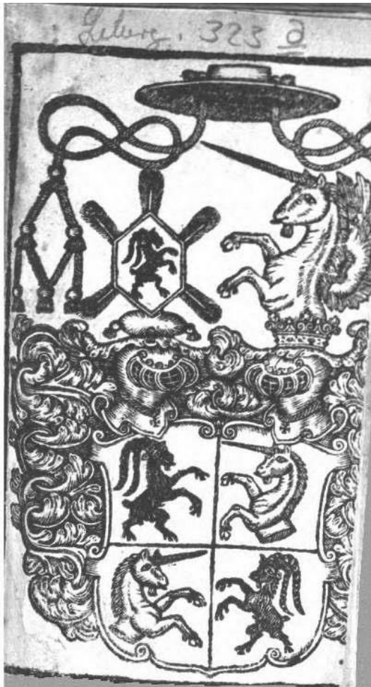
Arma da l'uestg Duri de Mont